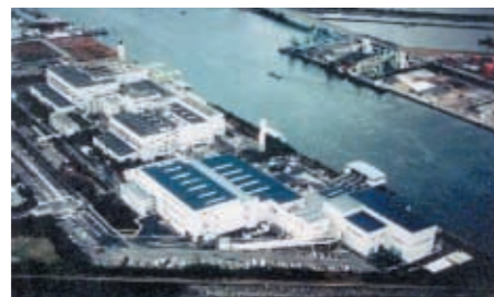
東京都京浜島不燃ごみ処理センター

その他以下の装置にも対応できます。 ・脱臭処理ー燃焼処理・薬液処理・触媒酸化処理 ・リサイクルプラントーコンベヤ・破碎機・圧縮梱包機・磁選機・その他